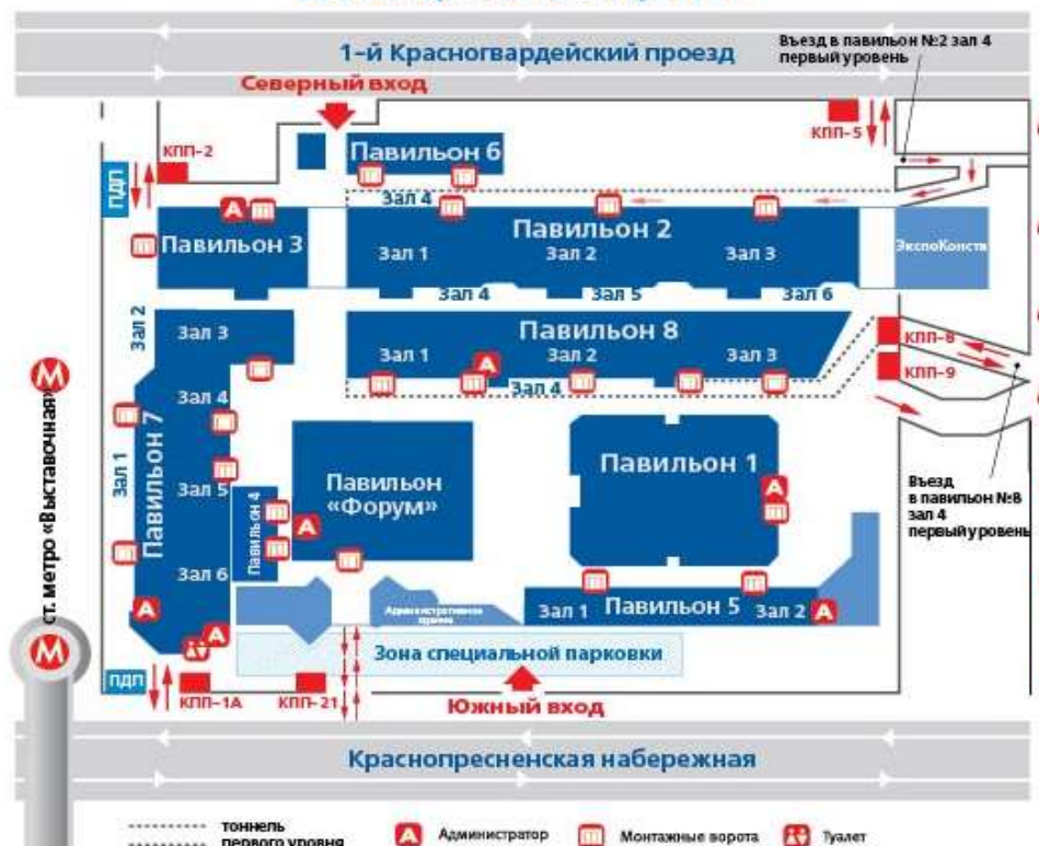
СХЕМА ЦВК «ЭКСПОЦЕНТР»